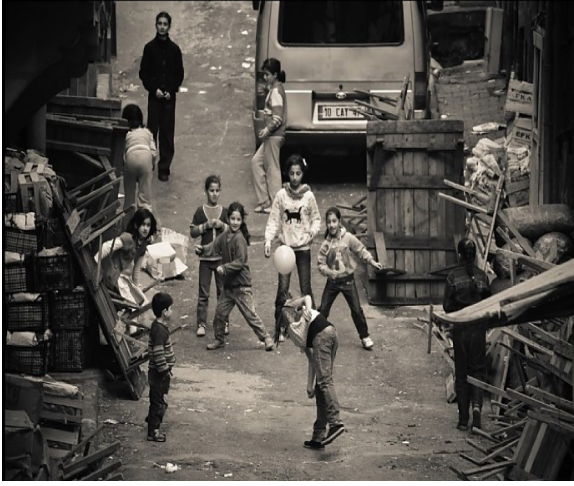
ÖNCE DEN ÇOCUKLAR